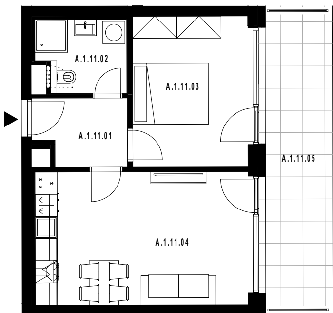
POLOHA JEDNOTKY V RÁMCI PODLAŽÍ