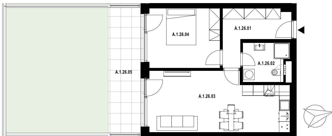
POLOHA JEDNOTKY V RÁMCI PODLAŽÍ