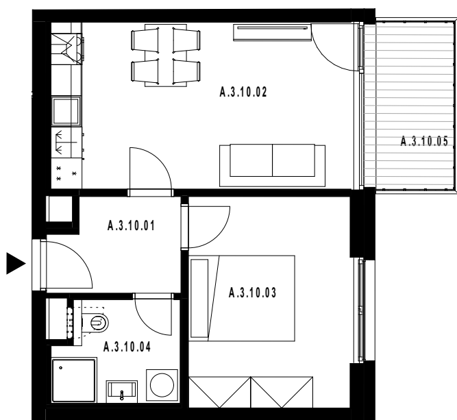
POLOHA JEDNOTKY V RÁMCI PODLAŽÍ