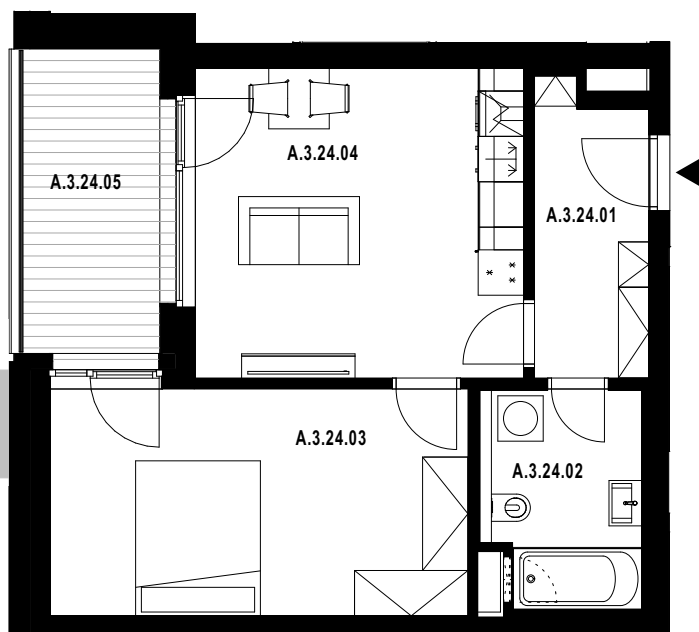
POLOHA JEDNOTKY V RÁMCI PODLAŽÍ