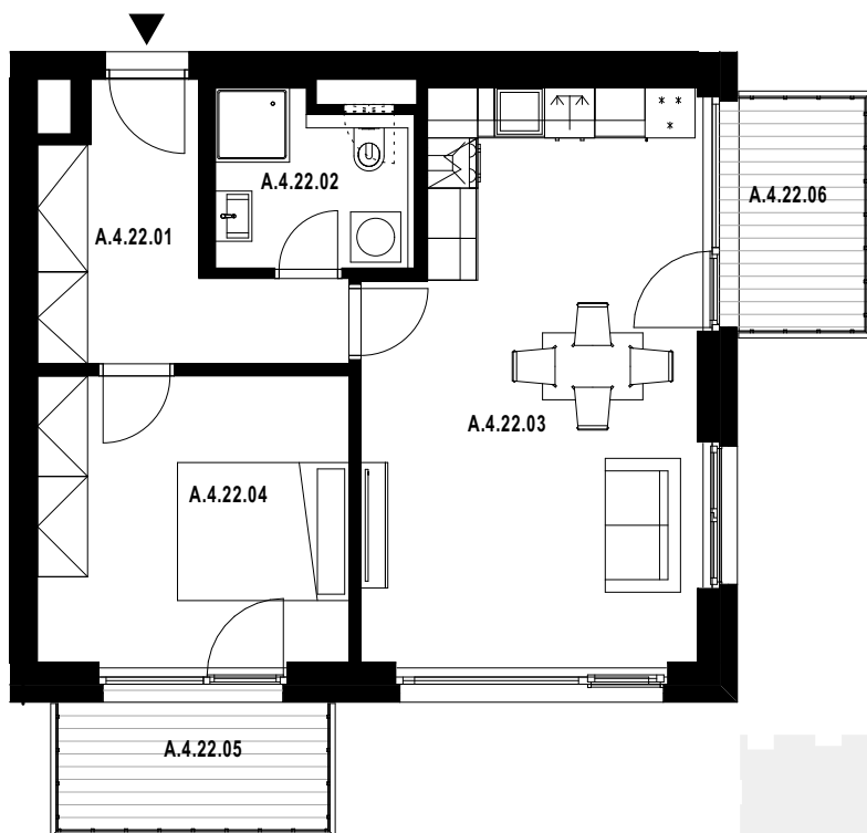
POLOHA JEDNOTKY V RÁMCI PODLAŽÍ