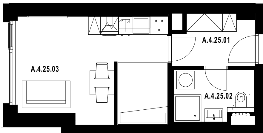
POLOHA JEDNOTKY V RÁMCI PODLAŽÍ