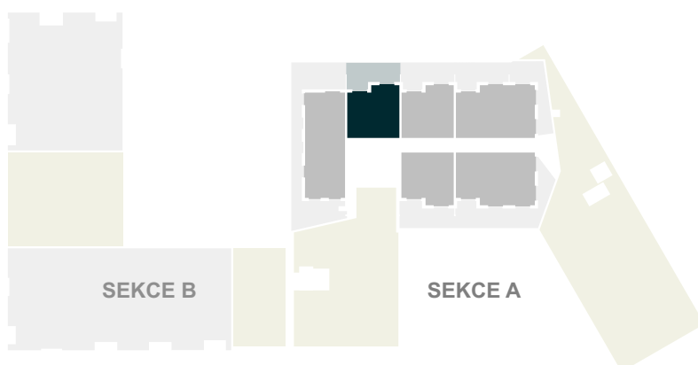
POLOHA JEDNOTKY V RÁMCI PODLAŽÍ

Pozn.: Součástí jednotky není kuchyňská linka, interiérové vybavení a svítidla.