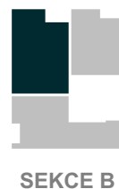
POLOHA JEDNOTKY V RÁMCI PODLAŽÍ