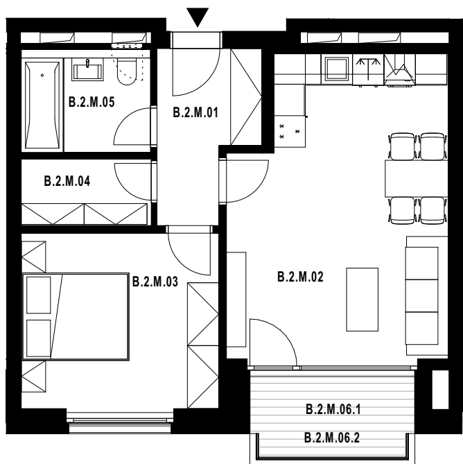
POLOHA JEDNOTKY V RÁMCI PODLAŽÍ