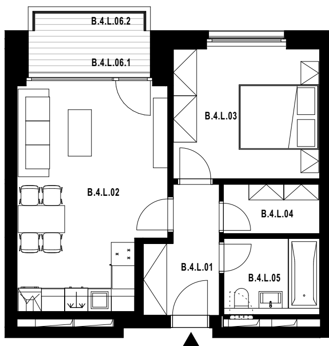
POLOHA JEDNOTKY V RÁMCI PODLAŽÍ