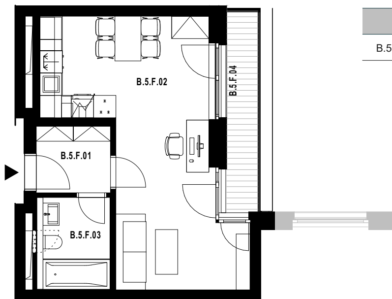
POLOHA JEDNOTKY V RÁMCI PODLAŽÍ