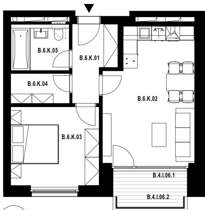
POLOHA JEDNOTKY V RÁMCI PODLAŽÍ